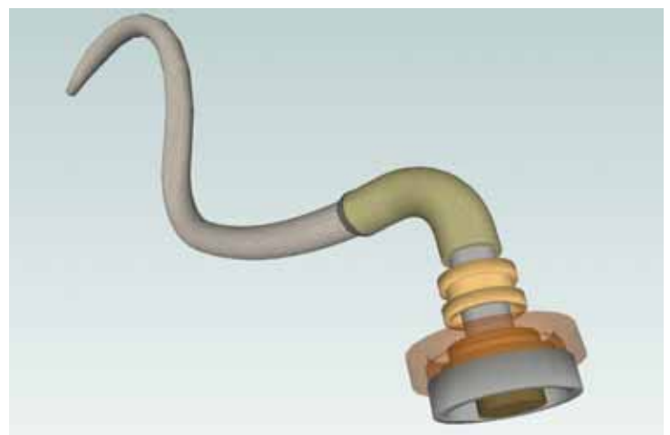
Fig. 9.- Flagelo bacteriano. Modelo de flagelo de una bacteria, considerado como de “complejidad irreductible” por los partidarios del “diseño inteligente”.

El flagelo bacteriano (Fig. 9), propuesto por Behe como ejemplo de complejidad irreductible, perdió credibilidad cuando Hueck (1998) publicó un estudio que muestra cómo un grupo de proteínas fundamentales para el funcionamiento del flagelo se utilizan en el sistema secretor de ciertas bacterias. Componentes de la membrana interna del aparato de secreción tipo III muestran homología con sustancias participantes en la biosíntesis de proteínas flagelares, mientras que un factor que se conserva en la membrana externa es