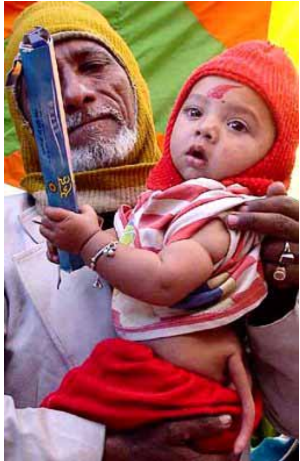
Fig. 4.- Bebe con cola. Presencia de apéndice caudal en humano actual, debido a que ocasionalmente no se reduce en el estado embrionario, se desarrolla y la persona nace con un apéndice caudal.

Los seres humanos presentamos múltiples características que demuestran nuestro origen evolutivo desde simios. La cola o apéndice caudal de nuestros ancestros, inútil, desapareció lentamente. Sin embargo, aún tenemos un hueso rudimentario, el cóccix, en la base de la columna vertebral, resto de un antiguo apéndice caudal, encerrado entre músculos. En el embrión de seis a doce semanas esta región caudal está claramente desarrollada, formada por 8 ó 9 rudimentos de vértebras. Sin embargo, no crece tan rápido como el cuerpo, y al finalizar este período se atrofia, formando un vestigio de entre 2 y 6 vértebras coccígeas que se sueldan formando el cóccix. Ocasionalmente no se reduce en el estado embrionario, se desarrolla y la persona nace con un apéndice caudal de unos 7,5 cm, a veces solo carnosos, algo móvil, y en algunos casos con ele-