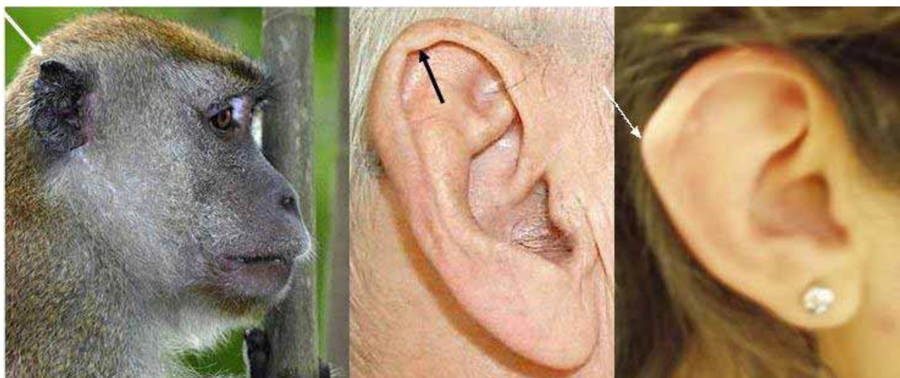
Fig. 6.- Tubérculo de Darwin. Engrosamiento ocasional de parte de la oreja humana que corresponde a la punta de la misma en simios como los babuinos. En algunas personas se manifiesta aún como una prominencia.

algunas personas tras cierta práctica logran moverlos, habilidad que no tiene utilidad alguna. Los últimos molares humanos, las “muelas del juicio”, son piezas dentarias que emergen tardíamente, las más variables en tamaño y momento de erupción, a menudo están sujetas a defectos, y a veces deben ser extraídas porque no existe el espacio suficiente para su desarrollo (Fig. 7 y 8). Nuestros antepasados poseían mandíbulas más grandes, por lo tanto en ellos eran funcionales, y posiblemente hace unos miles de años perdían varios dientes durante su juventud, por lo tanto les serían útiles, pero las conductas higiénicas actuales del cepillado dental permite mantener todos los dientes, y han pasado a ser un estorbo. En los mamíferos, incluyendo al ser humano, existe una pequeña estructura no funcional en el