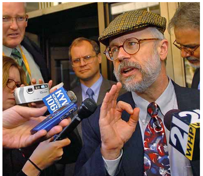
Fig. 2.- Michael Behe, proponente del diseño inteligente, difundiendo sus ideas en los medios de comunicación.

Los proponentes del diseño inteligente tratan de ocultar sus motivaciones religiosas, se puede pensar en otras motivaciones como el ansia de protagonismo, fama y enriquecimiento con la