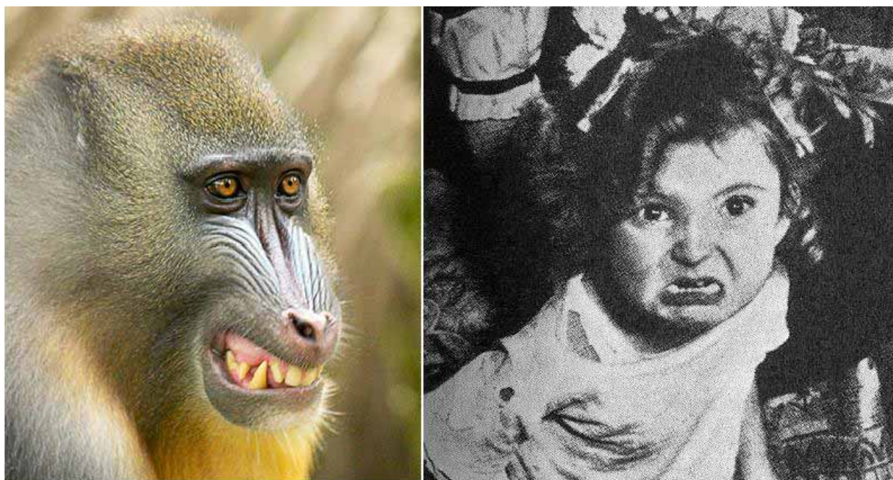
Fig. 5.- Gesto agresivo en simio y en humano. Gesto que en los simios muestra sus grandes caninos, y que realizan también algunas personas cuando se enfurecen, aún cuando nuestros caninos son muy pequeños.

algunas personas cuando se enfurecen, aún cuando nuestros caninos son muy pequeños (Fig. 5).