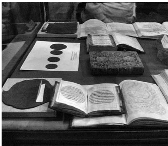
Algunos libros plúmbeos y documentación asociada que se exponen en el museo del Sacromonte.

Las falsificaciones del Sacromonte han continuado defendiéndose hasta la actualidad por casi todos los abades y canónigos, a pesar de la condena del Papa.