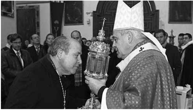
Izquierda: Falsas reliquias ofrecidas por el arzobispo para ser besadas por el alcalde de Granada en 2011. Derecha: Edificios que constituyen la abadía del Sacromonte, en el borde derecho se observa parte de las catacumbas.